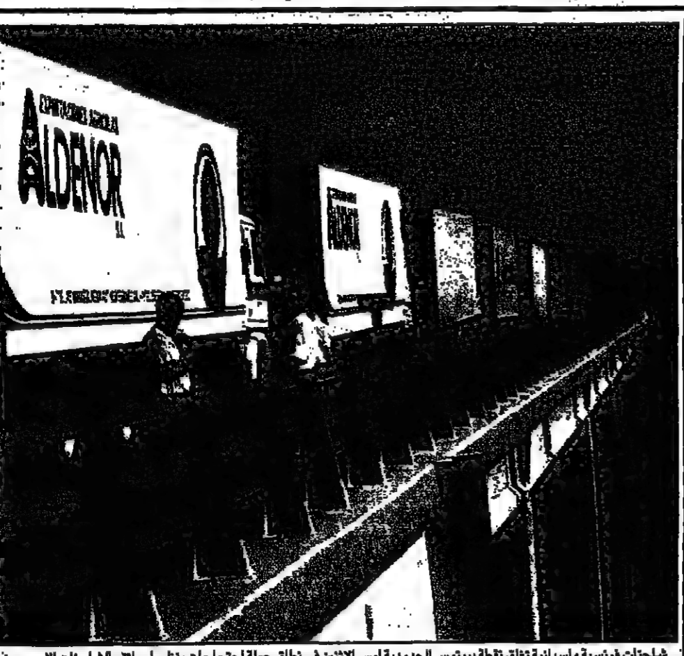
شاحنتان فرنسية واسبانية تعلقان لافتة ببيروت السورية أمس الاثنين في نطاق حملة احتجاجات يطالبها سائقي الشاحنات الاوروبيين بحلحلة الاتهامات الأوروبية، باصدار تصريحات مرحة لفسان حقوقهم وزيادة الحد الأدنى لجرورهم

دمشق - من شفاء الامام: أكد مصدر سوري مسؤول اجواء تيسر انترناشيال أمس الاثنين ان لجنة برئاسة عبد الحليم خدام نائب الرئيس السوري وخضوية بعض الوزراء قد شكلت لبحث امكانية اقامة سوق عربية مشتركة تضم دول اعلان دمشق، اي دول مجلس التعاون الخليجي الست إضافة الى سورية ومصر.